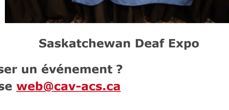
Saskatchewan Deaf Expo

Vous souhaitez organiser un événement ? Écrivez-nous à l'adresse web@cav-accs.ca