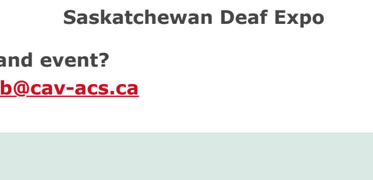
Saskatchewan Deaf Expo

Want to host an event? Contact us at web@cav-accs.ca